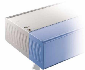
Mit integriertem Ansaugkasten