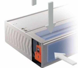
Mit Stellklappe für stufenlose Mischung aus Außenluft und Raumluft